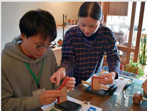
* レザークラフト体験