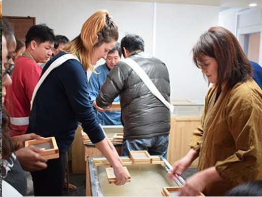
* 和紙の紙漉き体験