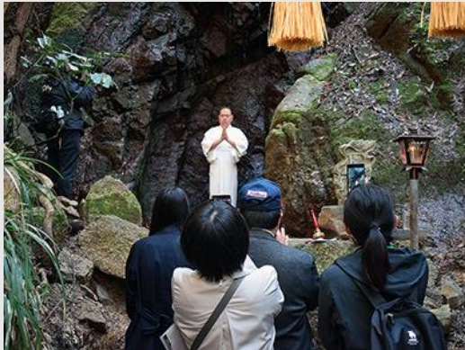
* 大阪の山での滝行体験

一般社団法人東大阪ツーリズム振興機構は、「ひがしおおさか体感まち博2019」を本番に見据え、これまでに実証実験に参画いただいた事業者の皆さまと「ひがしおおさか体感まち博2018プレ」と「外国人(インバウンド)向け体感まち博プレ」を行ってきました。