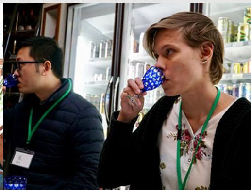
* 酒屋さんが行うお酒の飲み比べ